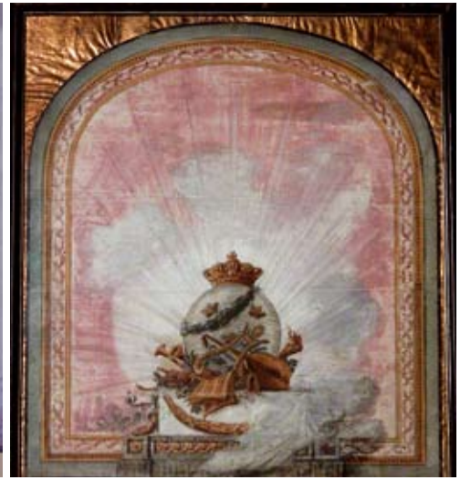
Ridåutkast för operan av Jacob Mörck.