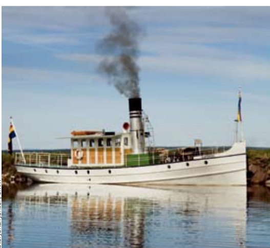
Ångfartyget Flottisten och segelfartyget Constantia är två av fartygen i Sjöhistorisk Årsbok .

Det är en bit medeltidshistoria som nu avtäcks invid Söder Målarstrands kaj, ett stenkast från Riddarholmen och Gamla Stan. Arkeologerna tror att båten var cirka tio meter lång och tre meter bred. C14-prover visar att den byggdes vid mitten av 1300-talet och övergavs runt år 1390. Den synliga delen av båten är kravellbyggd och skiljer sig därmed från de typiska nordiska klinkbyggda båtarna.