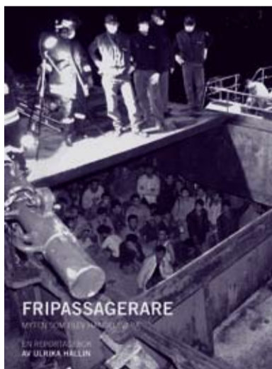
En engagerande bok av Ulrika Hallin.

Att vara fripassagerare är inte längre ett äventyr. Idag är det en del av en omfattande illegal migration till sjöss. Vi kan knappast föreställa oss de upppoffringar som krävs av de tiotusentals migranter som varje år riskerar allt för drömmen om ett bättre liv – ett liv i Europa. Frågan är högaktuell. Som en del av sitt uppdrag att ge perspektiv på samhällsutvecklingen har Statens maritima museer gett ut en ny bok: Fripassagerare – myten som blev handelsvara .