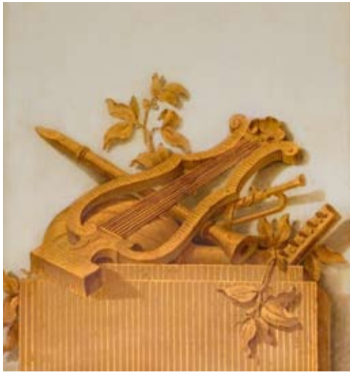
En av målningarna i Amphions kajuta.