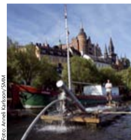
Utgrävningsplatsen vid Söder Målarstrand. En slamsug för upp material som ligger på vraket.