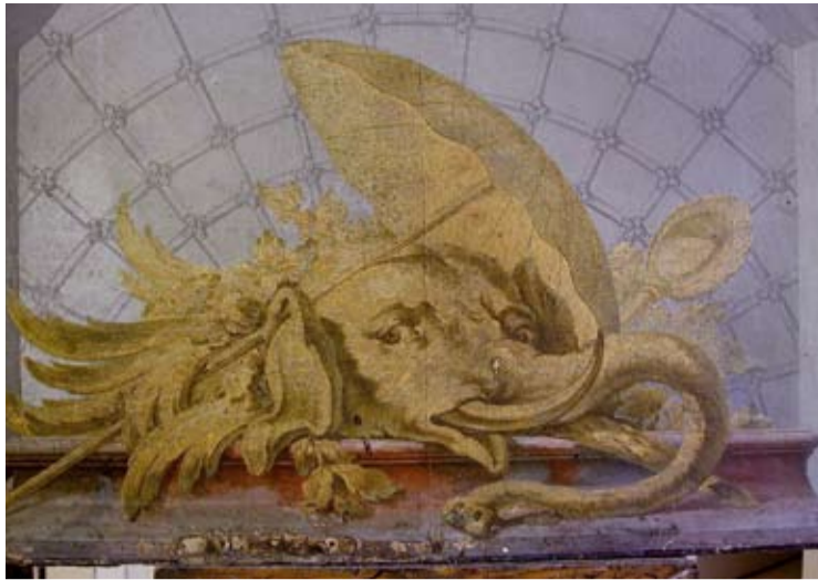
Ett dörröverstycke från Gustav III:s opera.